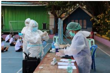
มาตรการตรวจ ATK ก่อนร่วมกิจกรรม