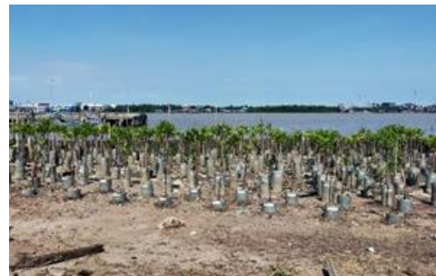
กิจกรรมปลูกป่า 29 สิงหาคม 2565 ณ สนามโรงเรียนป้อม พระจุลจอมเกล้า อำเภพระสมุทรเจดีย์ จังหวัดสมุทรปราการ