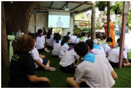
กิจกรรมให้ความรู้อบรมเชิงปฏิบัติการผ่านกิจกรรมค่ายเรียนรู้ ได้ร่วมพระบารมีจักรีวงศ์ รุ่นที่ 2 วันที่ 22 มิถุนายน 2565 ณ วัดจากแดง อำเภพระประแดง จังหวัดสมุทรปราการ