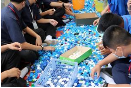
กิจกรรมให้ความรู้อบรมเชิงปฏิบัติการผ่านกิจกรรมค่ายเรียนรู้ ได้ร่วมพระบารมีจักรีวงศ์ รุ่นที่ 1 วันที่ 17 มีนาคม 2565 ณ โรงเรียนบางกอบัว อ.พระประแดง จ.สมุทรปราการ